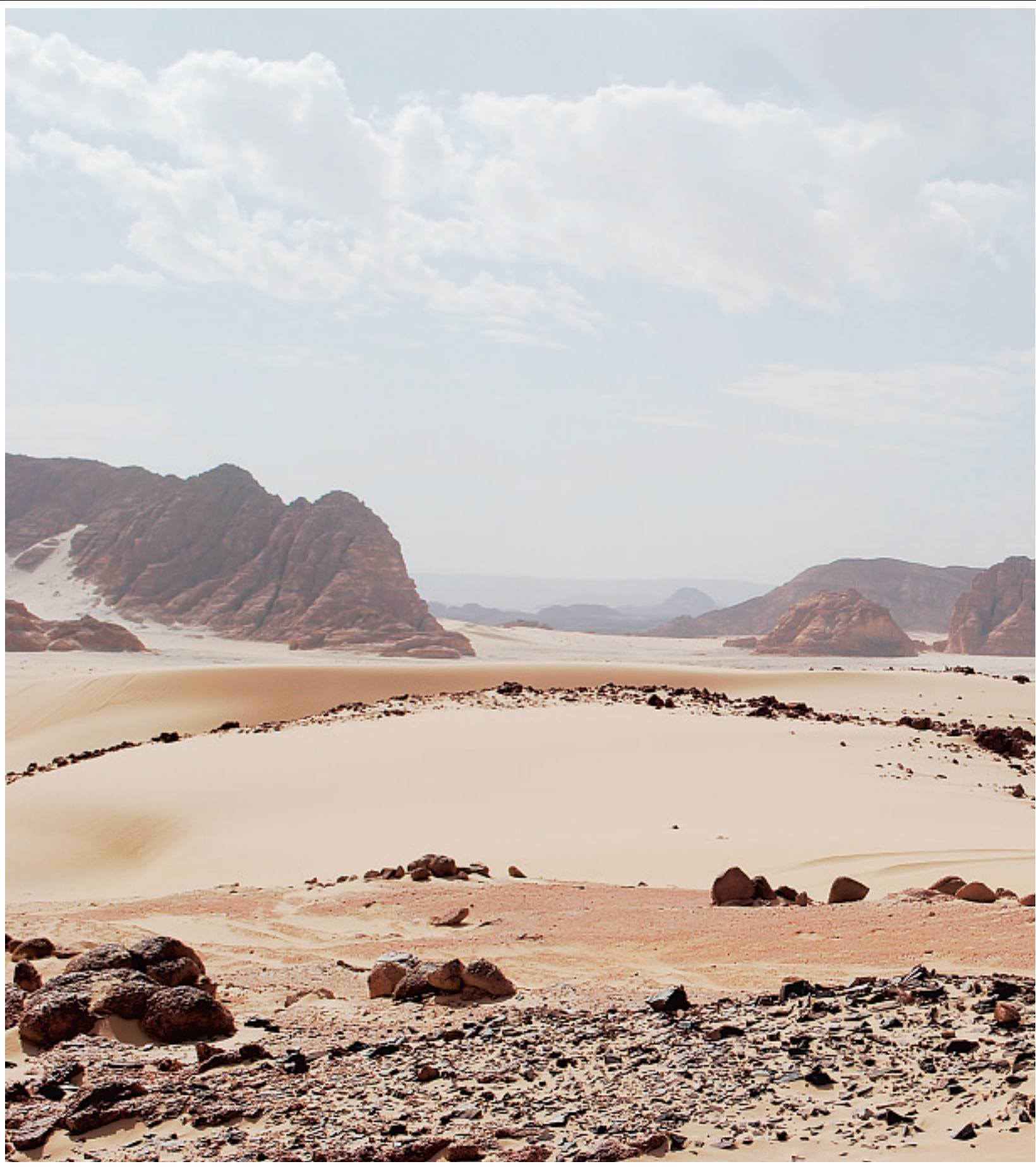
pagina 44, 27-08-2011